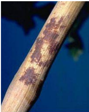
Κληματίδες με σκουρόχρωμες δικτυώσεις