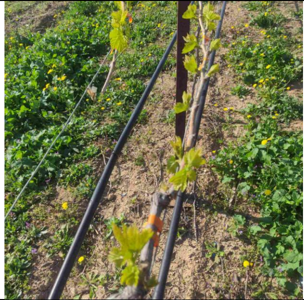
Πρώιμες ποικιλίες (21-3-2025)