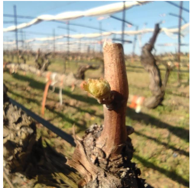
Όψιμες ποικιλίες (21-3-2025)