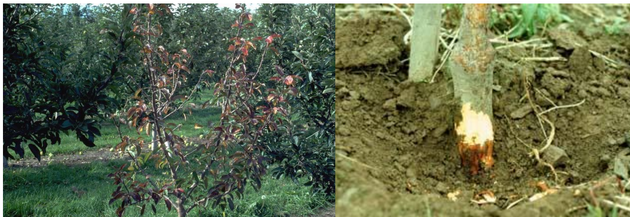
προσβολή Μηλιάς από Phytophthora