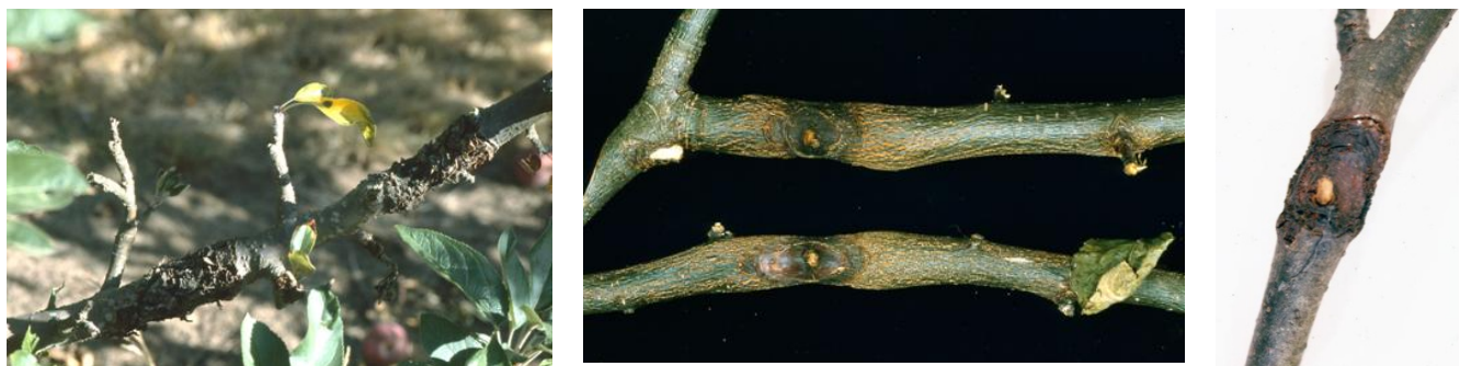
προσβολή Μηλιάς από Nectria galligena