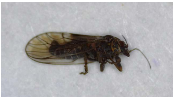
Αρσενικό Cacopsylla pyri