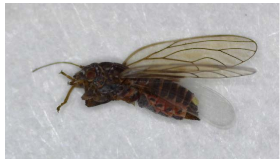
Θηλυκό Cacopsylla pyri