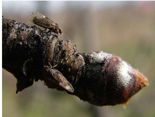
Ακμαία Cacopsylla pyri