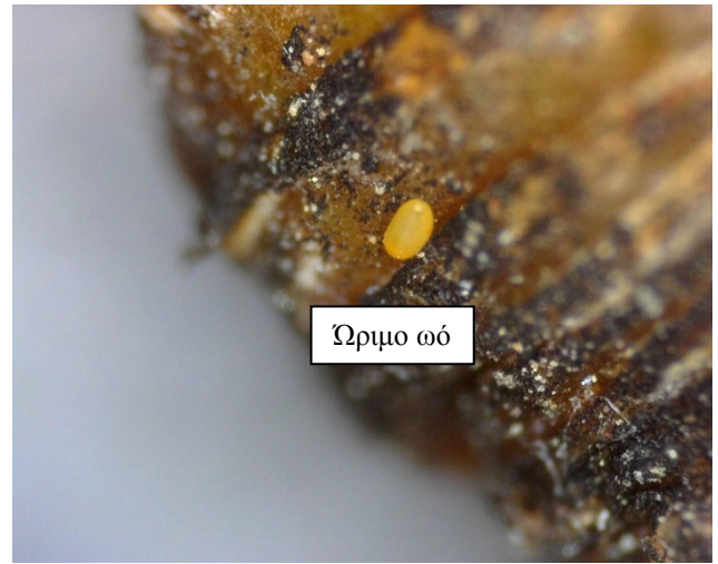
Ωά Cacopsylla pyri