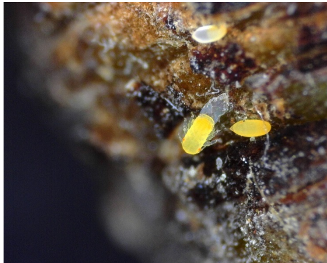
Εκκόλαψη ωού Cacopsylla pyri