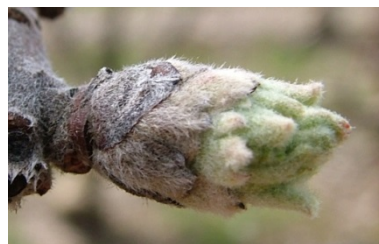
C 3 "αυτιά ποντικού"