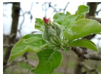
E ρόδινη κορυφή