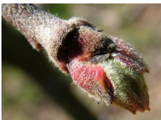
C πράσινη κορυφή