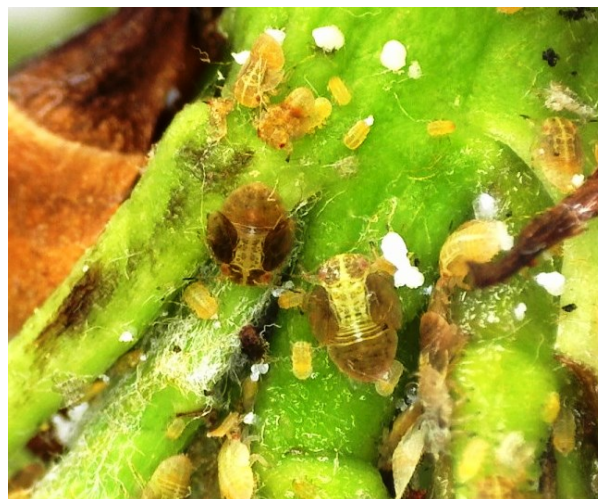
Αυγά και προνύμφες Cacopsylla pyri σε ταξιανθίες