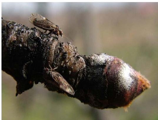
Ακμαία Cacopsylla pyri