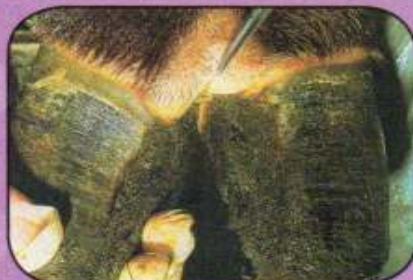
Φυσαλίδα στο μεσοδακτύλιο διάστημα νυχιών αγελάδας. (αλλοιώσεις 2 ημερών).