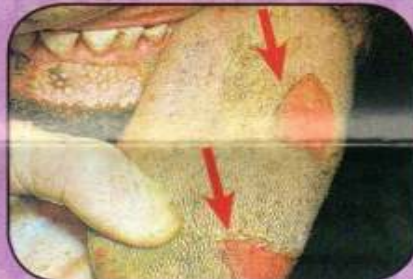
Αρχόμενη ίαση αλλοιώσεων στην άνω επιφάνεια γλώσσας μοσχίδας (3 ημερών) με ουλώδη ιστό περιμετρικά και οροϊνιδώδες εξίδρωμα.