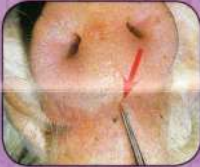
Φυσαλλιδώδεις αλλοιώσεις 1 ημέρας στο ρυγχός χοίρου.