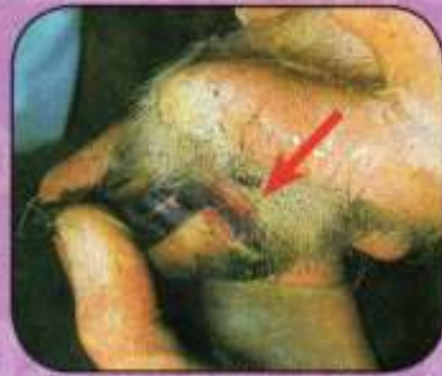
Αρχόμενη ίσση των αλλοιώσεων (4 ημερών) στα όρια δέρματος και νυχιού προβάτου.