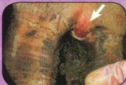
Αρχόμενη ίαση αλλοιώσεων μεσοδακτύλιου διαστήματος νυχιών αγελάδας (αλλοιώσεις 5 ημερών) με ουλώδη ιστό.