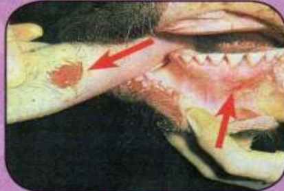
Ελκώδεις αλλοιώσεις 2 ημερών στην άνω επιφάνεια γλώσσας, και ούλα κάτω γνάθου της ίδιας μοσχίδας.