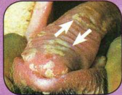
Αρχόμενη ίαση αλλοιώσεων (4 ημερών) με ουλώδη ιστό και ινική άνω επιφάνειας γλώσσας χοίρου.