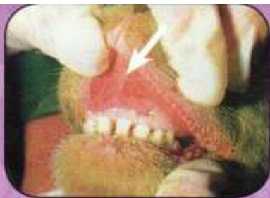
Ελκώδεις αλλοιώσεις 2 ημερών στο οδοντικό υπόθεμα άνω γνάθου προβάτου.