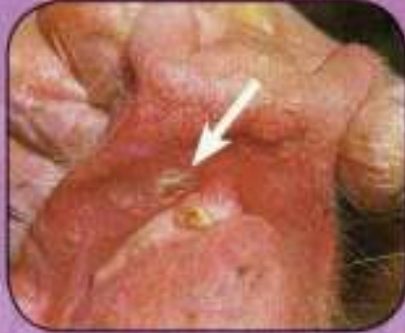
Υπεραιμία στο ρυγχός, κείλη και σύλα χοίρου (αλλοιώσεις 1 ημέρας)