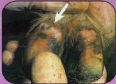
Υπεραιμία στο όριο μεταξύ δέρματος και νυχιού (αλλοιώσεις 2 ημερών σε πρόβατο).