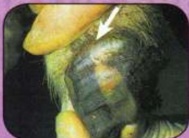
Υπεραιμία και συλλογή εξιδρωματικού υγρού στα όρια μεταξύ δέρματος και νυχιού (3 ημερών αλλοιώσεις) στο ίδιο πρόβατο.