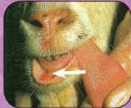
Ελκώδεις αλλοιώσεις 2 ημερών στην άνω επιφάνεια γλώσσας, άνω και κάτω χείλη γίδος.