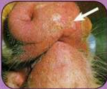
Ελκώδεις αλλοιώσεις 3 ημερών στον ίδιο χοίρο. Οφθαλμίδες εξιδρώμα και νέκρωση επιθηλίου