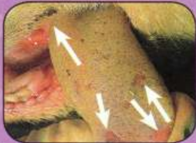
Ελκώδεις αλλοιώσεις 2 ημερών στην άνω επιφάνεια γλώσσας του ίδιου προβάτου.