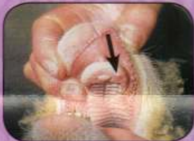
Ελκώδεις αλλοιώσεις 2 ημερών στο οδοντικό υπόθεμα και υπεραιμία άνω αίλου προβάτου.