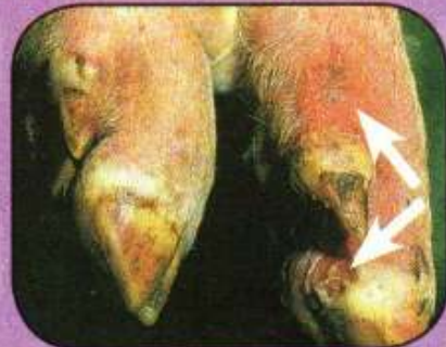
Υπεραιμία και ελκώδεις αλλοιώσεις στα κάτω άκρα χοίρου (αλλοιώσεις 3 ημερών)