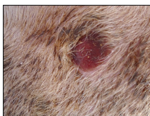
Προχωρημένες αλλοιώσεις ευλογιάς. Πληγές (έλκη).