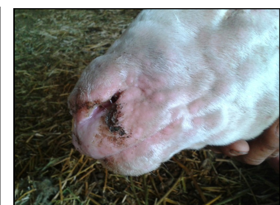
Πρόβατο με αλλοιώσεις ευλογιάς στο πρόσωπο. Κοκκινίλες (κηλίδες), κόκκινα σπυριά (βλατίδες) και μύξες (ρινικό έκκριμα).