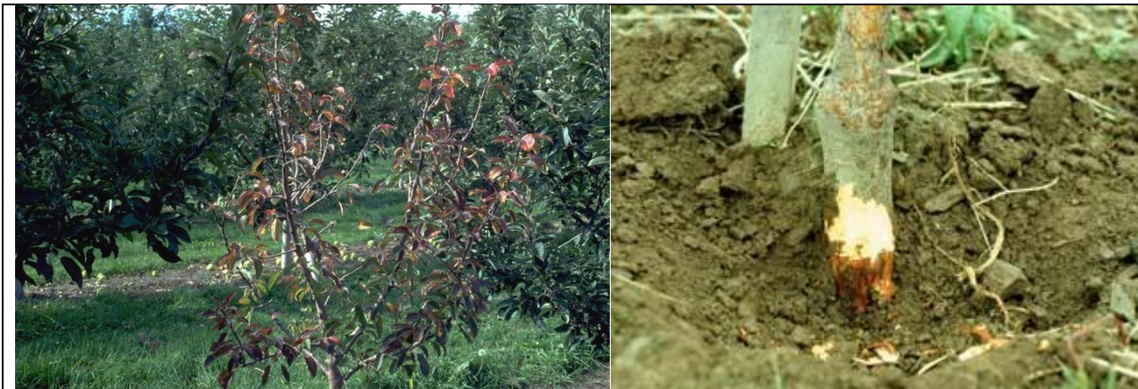
προσβολή Μηλιάς από Phytophthora