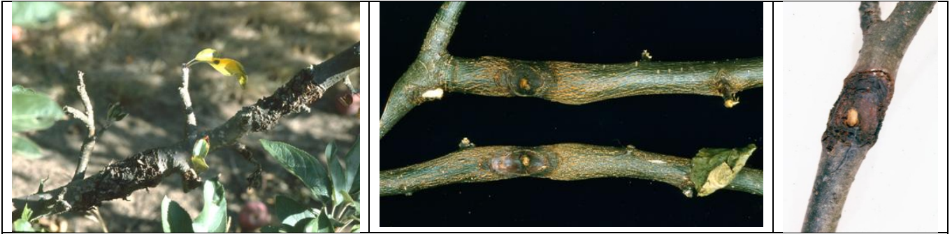
προσβολή Μηλιάς από Nectria galligena