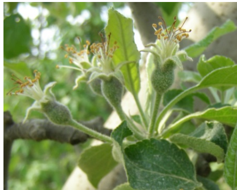
Η πλήρης πτώση πετάλων