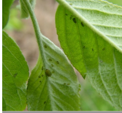
περίπου 15 άτομα πράσινης αφίδας