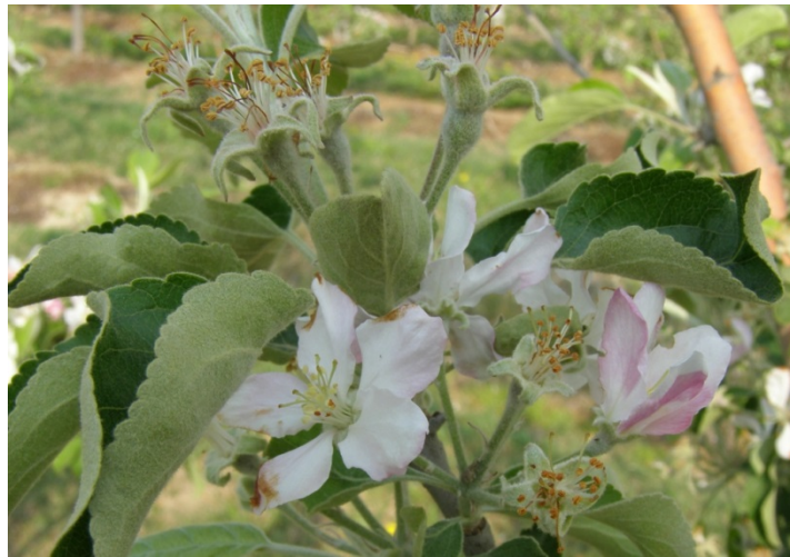
70 – 90% πτώσης πετάλων