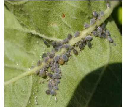
Dysaphis plantaginea ρόδινη αφίδα μηλιάς