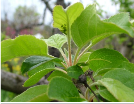
αφίδες στην κάτω επιφάνεια φύλλου