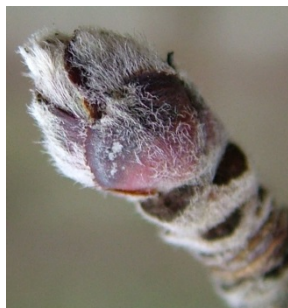
B φούσκωμα οφθαλμών, διαχωρισμός λεπιών