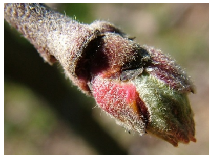
C πράσινη κορυφή