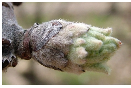
C 3 "αυτιά ποντικού" πράσινες κορυφές φύλλων εξέχουν από τα λέπια