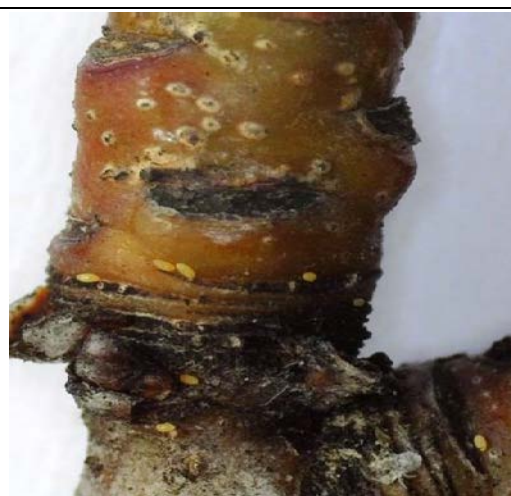
Ακμαία και ωά Cacopsylla pyri